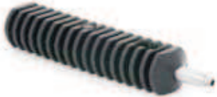
▶ PRZEBIJAK DO MONTOWANIA EMITERÓW I WKŁUWEK