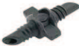
▶ ADAPTOR RAIN