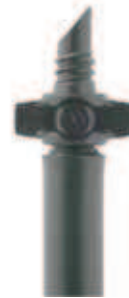
▶ PRZEDŁUŻKA RAIN 200 mm