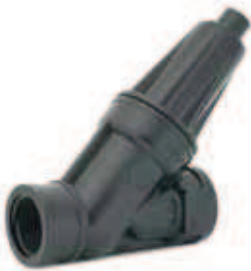
▶ REGULATOR CIŚNIENIA BERMAD E 3/4" 0,8-2,5 bar