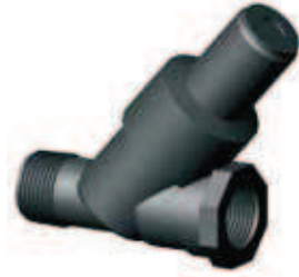
▶ REDUKTOR CIŚNIENIA 3/4"- 1,4 bar IRRITEC