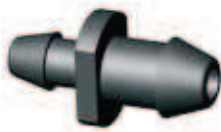
▶ WKŁUWKA 7x7 MM