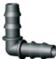
▶ KOLANO 5-5 DO RURY PCV 5