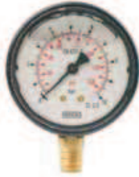
▶ MANOMETR GLICERYNOWY 3/8" M